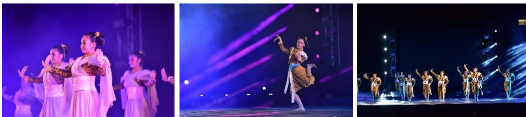
ภาพที่ 5 การออกแบบแสงและสีในการสร้างสรรค์การแสดงนาฏศิลป์สร้างสรรค์ ชุด พกุล

2.4 การออกแบบแสงและสีในการสร้างสรรค์การแสดงนาฏศิลป์สร้างสรรค์ ชุด พกุล พบว่า มีการใช้เทคนิคแสงมาช่วยเสริมการแสดงนาฏศิลป์สร้างสรรค์ให้ดูโดดเด่น โดยกำหนดสีและแสงของแต่ละช่วงการแสดง ดังนี้ ช่วงที่ 1 การสลิตของดอกพิกุลบนสรวงสวรรค์ ใช้สีและแสง คือ ฟ้า เหลือง ขาว สื่อถึงความรู้สึกบริสุทธิ์ สดใส ช่วงที่ 2 พิกุลเงิน พิกุลทองบนโลกมนุษย์ ใช้สีและแสง คือ ส้ม เหลือง ขาว ฟ้า ชมพู แดง สื่อถึงความรู้สึกมีพลัง รื่นเริง เปรมปรีดี