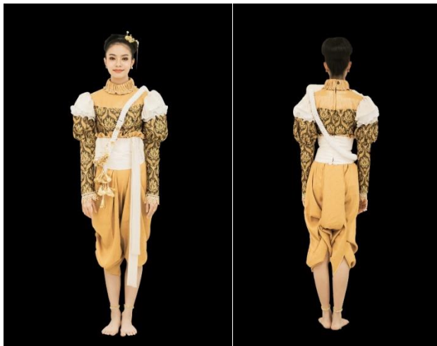
ภาพที่ 2 ภาพเครื่องแต่งกายด้านหน้าและด้านหลังช่วงที่ 2

2.3 ประดิษฐ์ทำรำประกอบการแสดงนาฏศิลป์สร้างสรรค์ชุด พกุล พบว่า การแสดงนาฏศิลป์สร้างสรรค์ชุด พกุล มีการสร้างสรรค์ทำรำโดยมีแนวคิดมาจากทางพฤกษศาสตร์ของต้นพิกุล และในจินตนาการเมื่อนึกถึงดอกพิกุล โดยคณะผู้วิจัยได้สร้างสรรค์กระบวนทำรำให้มีความหมายตรงกับรูปแบบของการแสดง เน้นความพร้อมเพรียงเพื่อให้เกิดความสวยงาม สื่อความหมายด้วยกระบวนทำรำให้มีความสอดคล้องกับทำนองเพลง เอกลักษณ์ของการแสดงนาฏศิลป์สร้างสรรค์ชุด พกุล มีลักษณะเด่นคือการใช้มือ และลำตัว