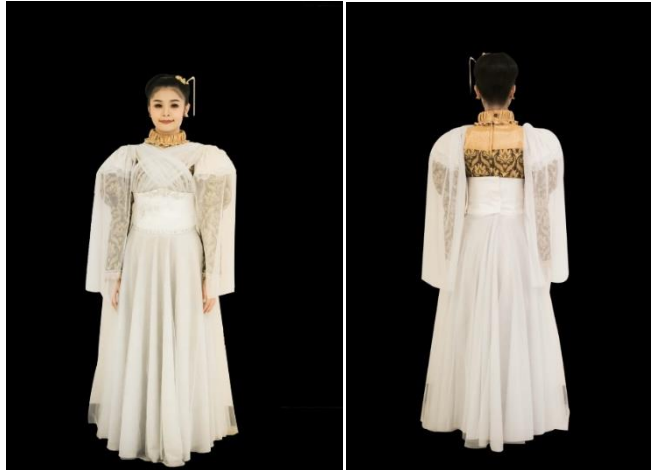
ภาพที่ 1 ภาพเครื่องแต่งกายด้านหน้าและด้านหลังช่วงที่ 1